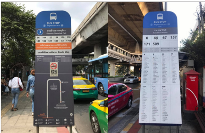
ภาพที่ 2 ตัวอย่างป้ายรถเมล์แบบใหม่

ป้ายรถเมล์รูปแบบใหม่ถูกพัฒนาขึ้นให้อ่านง่าย ไม่ซับซ้อน โดยในหนึ่งป้ายจะมีข้อมูลสองด้าน มีการระบุข้อมูลสัญลักษณ์ป้าย ชื่อตำแหน่งป้าย สายรถเมล์ที่ให้บริการ จุดหมายปลายทางที่รถเมล์ผ่าน เส้นทางการเดินทางโดยสังเขป ทั้งภาษาไทยและภาษาอังกฤษ จุดจอดรถเมล์ที่สำคัญ รวมทั้งสัญลักษณ์ และเบอร์โทรศัพท์ฉุกเฉิน ดังภาพที่ 2 ปัจจุบันได้เริ่มติดตั้งไปบ้างแล้วในพื้นที่ชั้นในของกรุงเทพมหานคร ตลอดแนวเส้นทางรถไฟฟ้า ซึ่งเป็นย่านธุรกิจ และย่านที่มีการเดินทางของประชาชนเป็นจำนวนมากในแต่ละวัน โดยการติดตั้งในช่วงแรกได้รับผลตอบรับอย่างดี สำหรับในปีงบประมาณ 2562 ดำเนินการติดตั้งไปแล้วจำนวน 500 ป้าย ในพื้นที่เขตจตุจักร พญาไท ราชเทวี บางรัก ดินแดง วัฒนา สาทร และคลองเตย และในปีงบประมาณ 2563 ติดตั้งเพิ่มเติม 500 ป้าย ในเขตพระนคร ดุสิต และป้อมปราบศัตรูพ่าย (กรุงเทพมหานคร, 2562, ออนไลน์)