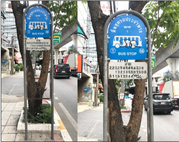
ภาพที่ 1 ตัวอย่างป้ายรถเมล์แบบเก่า